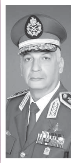
الفريق أول محمد زكي

وفي سياق متصل، التقى الفريق محمد فريد رئيس أركان حرب القوات المسلحة الفريق أول كينيث ماكينزي، وتناول اللقاء عدداً من الموضوعات ذات الاهتمام المشترك في ضوء علاقات التعاون العسكري وتبادل الخبرات بين القوات المسلحة للبلدين. ■