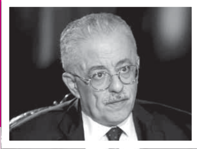
د. طارق شوقي

وكشف الوزير عن ملامح امتحان الثانوية العامة للعام الدراسي الجديد 2020-2021، والتي من المقرر أن تبدأ بحسب الخطة الزمنية التي اعتمدها المجلس الأعلى للتعليم قبل الجامعي السبت 19 يونيو 2021، بحيث يتم تقسيم الطلاب في كل مادة لمجموعات متعددة على حدة وفي أوقات مختلفة، وبنظام الـ «open book» أو «الكتاب المفتوح» وبحيث تكون جميع نماذج الامتحان متساوية في درجة الصعوبة لتحقيق مبدأ تكافؤ الفرص. وعن المراحل الأولى في التعليم، ذكر الدكتور طارق شوقي، أن نظام التعليم الجديد 2.0 (المطبق على صفوف رياض الأطفال للثالث الابتدائي)، واستخدام التكنولوجيا الحديثة في المرحلتين الإعدادية والثانوية والتعليم المدمج، أنظمة مستقبلية وليست مرتبطة بانقراض كورونا فقط وسيتم تعميم ذلك خلال السنوات المقبلة للقضاء على المشاكل التي تواجه عملية التعليم في مصر التي أبرزها الكثافة العددية، وعجز المعلمين. ■