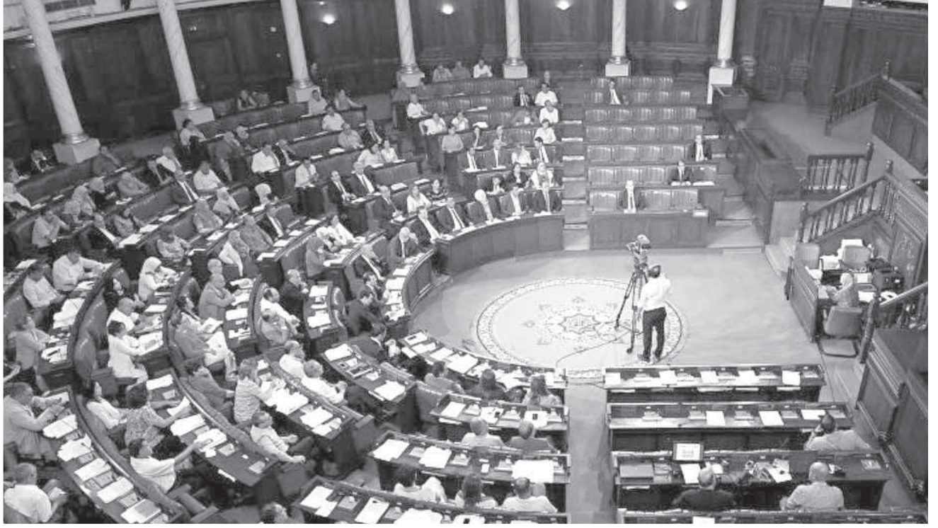
جلسة سحب الثقة في البرلمان التونسي من حكومة الفخفاخ

خلال أقل من شهرين، وعلى غرار «أرشيف وثائق المقاومة النمساوية»، المعنى بتوثيق جرائم وتحركات اليمين المتطرف والنازيين الجدد، فإن مركز توثيق الإسلام السياسي سيكون مؤسسة مستقلة مدعومة مباشرة من الحكومة النمساوية، ويتولى نشر كتب ومقالات وأبحاث جديدة، وأرشفة المنشورات الحالية، المتعلقة بالإسلام السياسي، والتنظيمات الإسلامية المتطرفة، ومن المنتظر أن يركز المركز عمله على جماعات الإخوان، وحزب الله اللبناني، والذئاب الرمادية التركية وغيرها من التنظيمات المتطرفة.