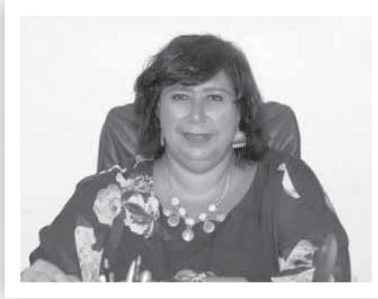
د. إيناس عبدالدايم

■ ■ إن مصر العظيمة لم تكن تواجه فقط جائحة فيروس حير العالم واهتزت تحت عروش الطغاة بل كانت تواجه تحديات وأطماع المستعمرين لحماية أمنها الداخلى والخارجى وتحاول إفساد المؤامرات التى تحاك حولها من تركيا والمختل إردوغان شمالاً والإدارة الأثيوبية الغبية جنوباً وقطر شرقاً والرعاية الصهيونية الأمريكية فى أقصى الغرب لصيانة أمنها القومى وفى الوقت نفسه لم تتوقف عن إعادة الحياة للأفضل بعد الجائحة وأيضاً البناء لتحقيق رفاهية شعبها بعد القضاء على منابع الإرهابيين المفسدين فى الأرض. ■