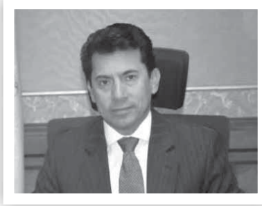
د. أشرف صبحى

من المبادرة التى تتبناها وزارة الرياضة لتوفير 1000 دراجة هوائية إلكترونية بسعر مدعم للمواطنين وذلك فى إطار توجيهات الرئيس عبدالفتاح السيسى بتوسيع قاعدة الممارسة الرياضية وجعل الرياضة أسلوب حياة، بالإضافة إلى أنها وسيلة انتقال صديقة للبيئة.