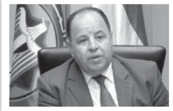
د. محمد معيط

استعرض الدكتور محمد معيط، وزير المالية، الجهود المبذولة من رجال الجمارك لتذليل العقبات وتيسير الإجراءات الجمركية أمام مجتمع الأعمال؛ بما يسهم في تحسين أداء العمل بالإدارات الجمركية، وتقليص زمن الإفراج الجمركي، على النحو الذي يساعد في تلبية احتياجات السوق المحلية، واستقرار الأسعار.