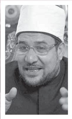
د. محمد مختار جمعة

اعتمد الدكتور محمد مختار جمعة، وزير الأوقاف، صرف مبلغ ستة ملايين جنيه كدفعة أولى للعام المالي الحالي 2020 / 2021 من باب البر والإعانات من الموارد الذاتية للوزارة للأسر الأولى بالرعاية وأصحاب الأمراض المزمنة والمرأة المعيلة المسجلين على قوائم البر بإدارات البر بمديريات الأوقاف على مستوى الجمهورية. وقال وزير الأوقاف إن اعتماد صرف المبلغ المشار إليه يأتي إسهاماً من الوزارة في التخفيف عن الأسر الأكثر احتياجاً في ظل الظروف الراهنة، وذلك بمناسبة عيد الأضحى المبارك أعاده الله على الأمتين العربية والإسلامية بالخير واليمن والبركات والأمن والأمان، كما قرر إدراج جميع الأسرة في قوائم الأسرة المستهدفة في مشروع صكوك الأضاحى. وكان وزير الأوقاف وقع مع الدكتور على المصيلحي وزير التنمية والتجارة الداخلية بروتوكول تعاون لتوفير 700 طن لحوم أضاحى نحو أربعة آلاف رأس من البقر تقريباً لتوزيعها مجاناً على الأسر الأولى بالرعاية. ■