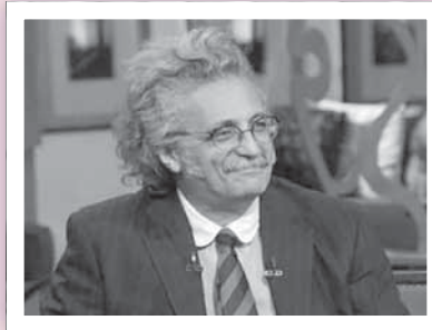
د. حسين خيرى - نقيب الأطباء

19»، ومن هذا المنطلق صدر القرار لإيصال أكبر استفادة للمصابين وأسرى الشهداء، وكذلك دعم المستشفيات بمستلزمات مكافحة العدوى.