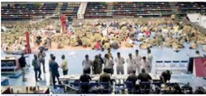
صالة ألعاب رياضية بأقصر تحوّل لمعتقل