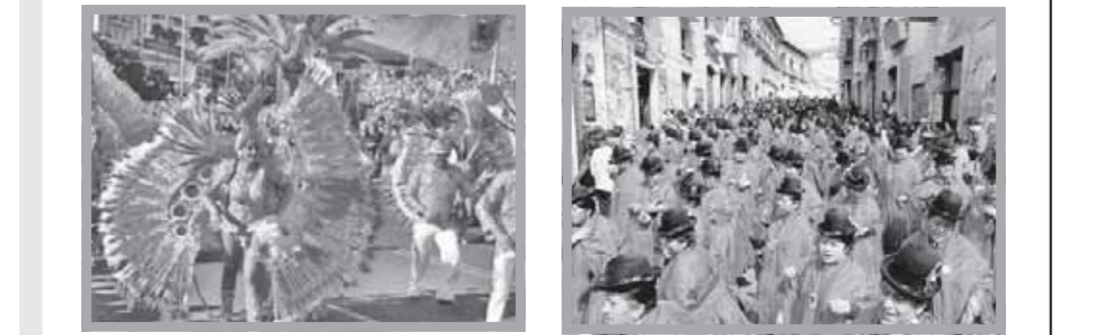
المكان: بوليفيا الزمان: يونيو المناسبة: مهرجان «سيد القوى العظمى»

تُنظَم مدينة لاياز في بوليفيا في شهر يونيو مهرجان «سيد القوى العظمى» وهو حدث سنوي، يرتدى الرجال أزياء واقعة بيضاء لامعة، وجسدوا العبيد الأفارقة الذين، وفقا للمعتقدات الشعبية، عملوا في مناجم الفضة في بوليفيا قبل أن يتمكنوا من الضرار.