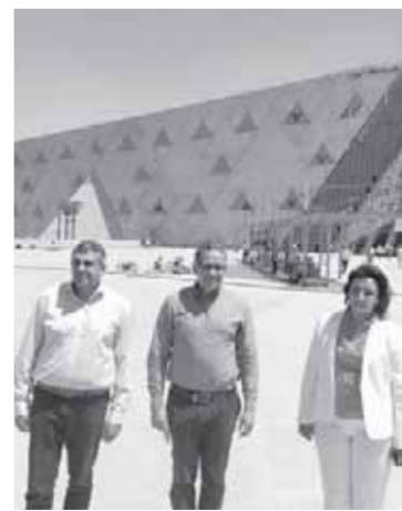
خلال جولة وزير السياحة والآثار بالهرم

قام الدكتور خالد العناني وزير السياحة والآثار، وزوراب بولوليكاشفيلي الأمين العام لمنظمة السياحة العالمية والوفد المرافق له بزيارة لمنطقة آثار الهرم، حيث تفقدا منطقة البانوراما وقاما باتباع الإجراءات الاحترازية. كما قاما بتطهير أيديهما بالمطهرات والكحول. وعقب جولة الهرم اتجه العناني وأمين عام منظمة السياحة العالمية إلى المتحف المصري الكبير، حيث كان في استقبالهما اللواء عاطف مفتاح المشرف العام على مشروع المتحف الكبير والمنطقة المحيطة به، حيث شاهد بولوليكاشفيلي البهو العظيم وتمثال الملك رمسيس وخرابيش الملوك على جدران المتحف، وحرصوا على التقاط صورة تذكارية مع خرابيش الملوك.