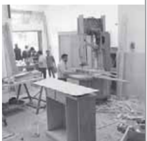
منتجات «الصايدة» تقتحم الأسواق العالمية