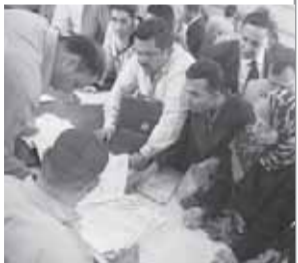
الضرائب تستعد لموسم الإقرارات مبكراً