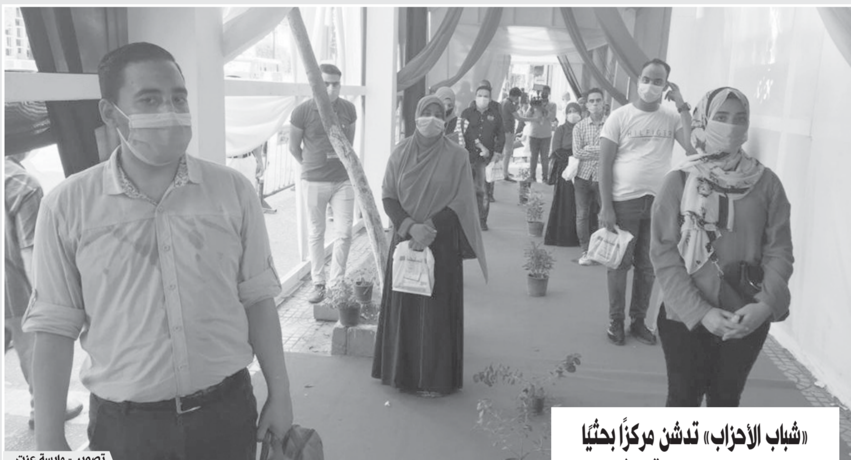
تصوير - مایسة عزت