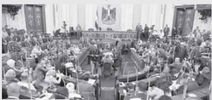
تصوير - مایسة عزت