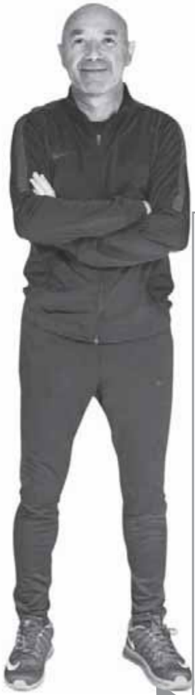
ريفاة بانيولوك جديد