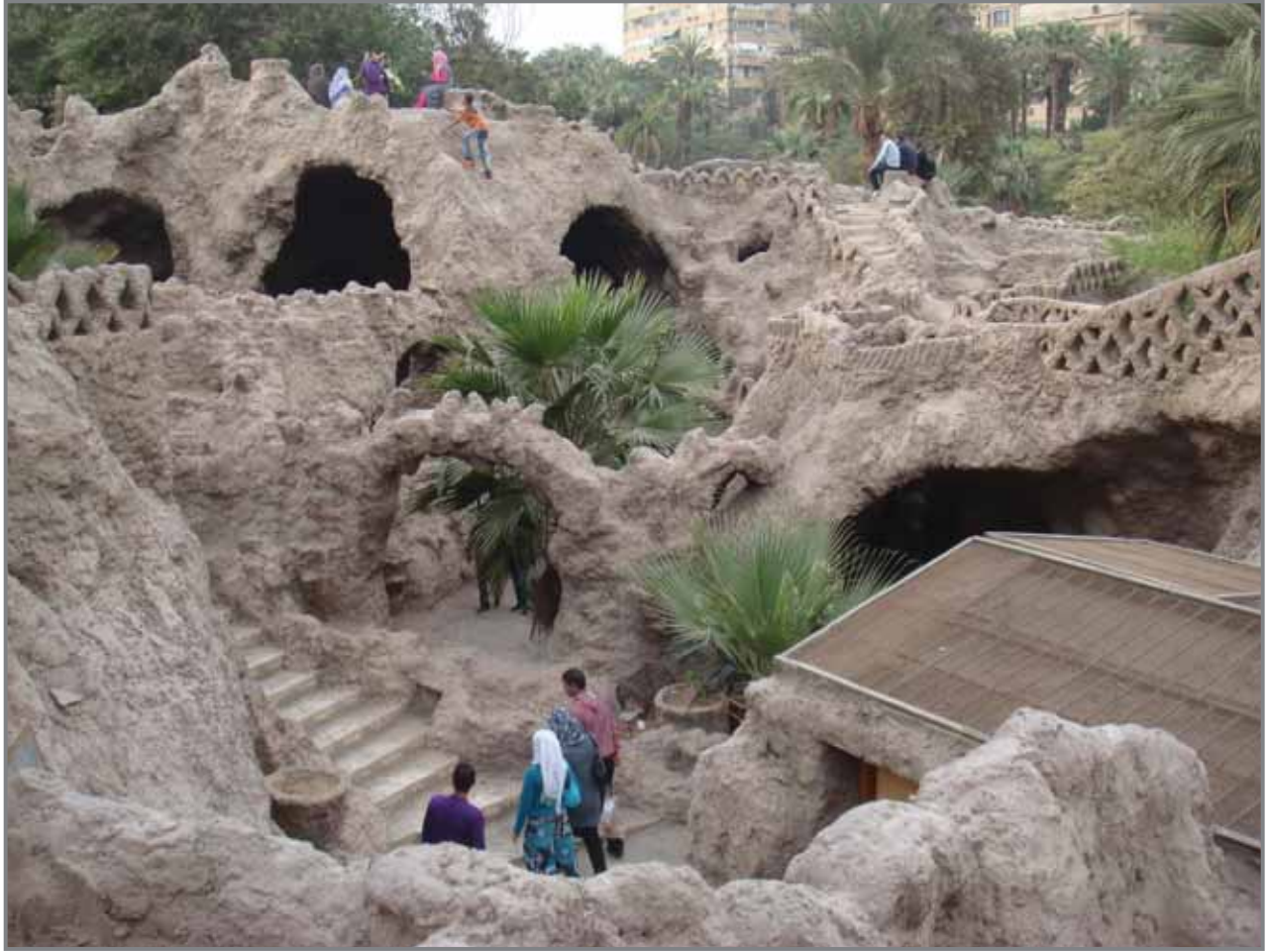
مفارة حديقة الأسماك