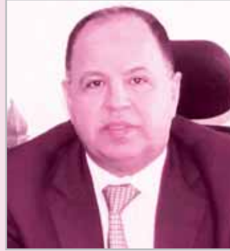
د. محمد معيط