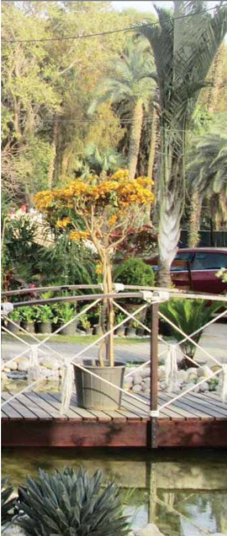
الأورمان نزهة العائلات وبيع الورد

"الله الله على الحب الحُب.. عقبالكوا كده ما تطبوا وتبقى حياتكم قصة حُب.. هكذا غنت الفنانة الراحلة سعاد حسنى فى فيلم "خلى بالك من زوزو" الذى ألفه الشاعر الراحل صلاح جاهين عام 1972 على الجسر الخشبي التراثي بحديقة "الأورمان".