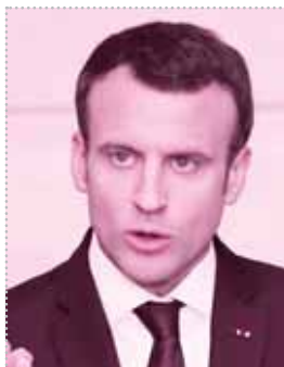
الرئيس الفرنسي ماكرون

القانون المزمع تقديمه وفقاً لما أعلنه الرئيس الفرنسي «ماكرون» في خطاب ألقاه الجمعة الماضية - بمدينة «لى مور»، يهدف لحماية الجمهورية من الانفصالية، ولاسيما الإسلام الراديكالي من خلال مشروع قانون من شأنه أن يعزز العلمانية، ومن المفترض أن يتم عرضه على مجلس