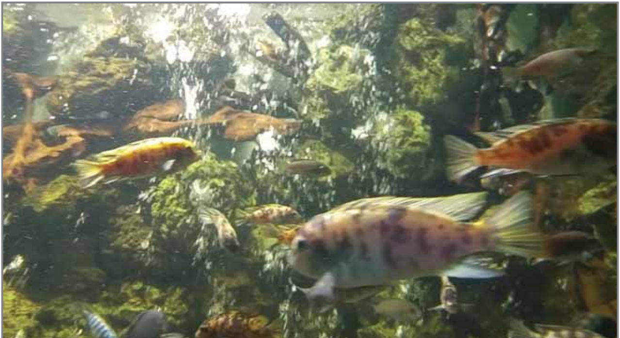
أسماك نادرة وتاريخ طويل

بدأ إنشاء الحديقة عام 1867، على يد الخديو إسماعيل صاحب التطلعات الكبيرة الذي كان يرغب في أن يجعل مصر قطعة من أوروبا، وأسس ما يُعرف بمنطقة "وسط البلد" الخديوية في القاهرة، وقد جاء بمهندس خبير في تأسيس المتنزهات خصيصاً من باريس كي يضع مخطط الحديقة ويُسرف على إنشائها.