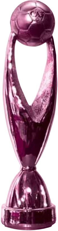
كأس دورى أبطال أفريقيا

تعرض لإصابة فى مباراة المقاولون العرب ولكن الفريق الطبى التابع للنادى أكد إمكانية مشاركته أمام الوداد. ولدى الأهلى الكثير من الأوراق الهجومية الراححة فى مقدمتها حسين الشحات ومحمود كهربا ومروان محسن وأليو بادجى.