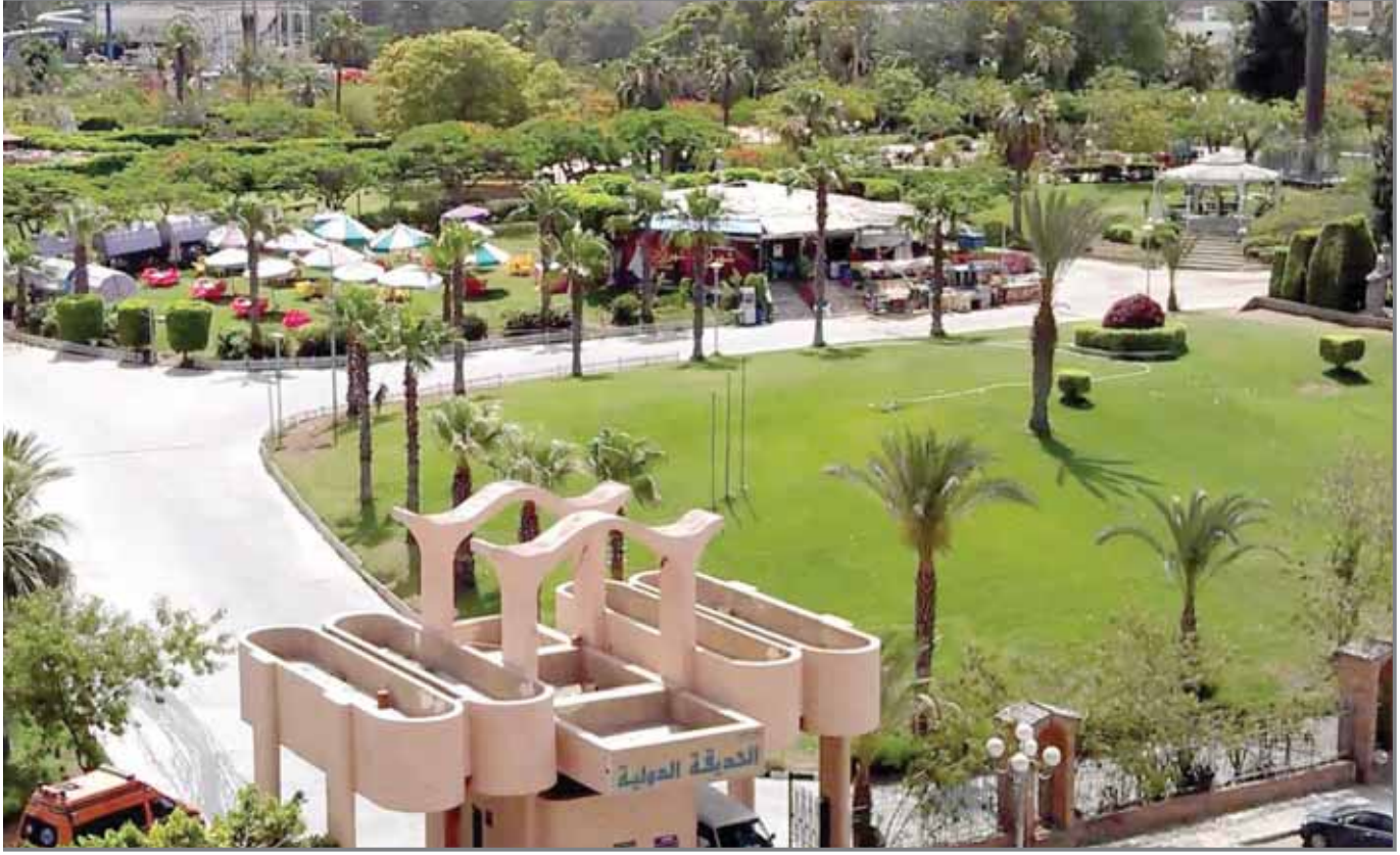
مربع أخضر عربيون صداقة بين مصر و العالم