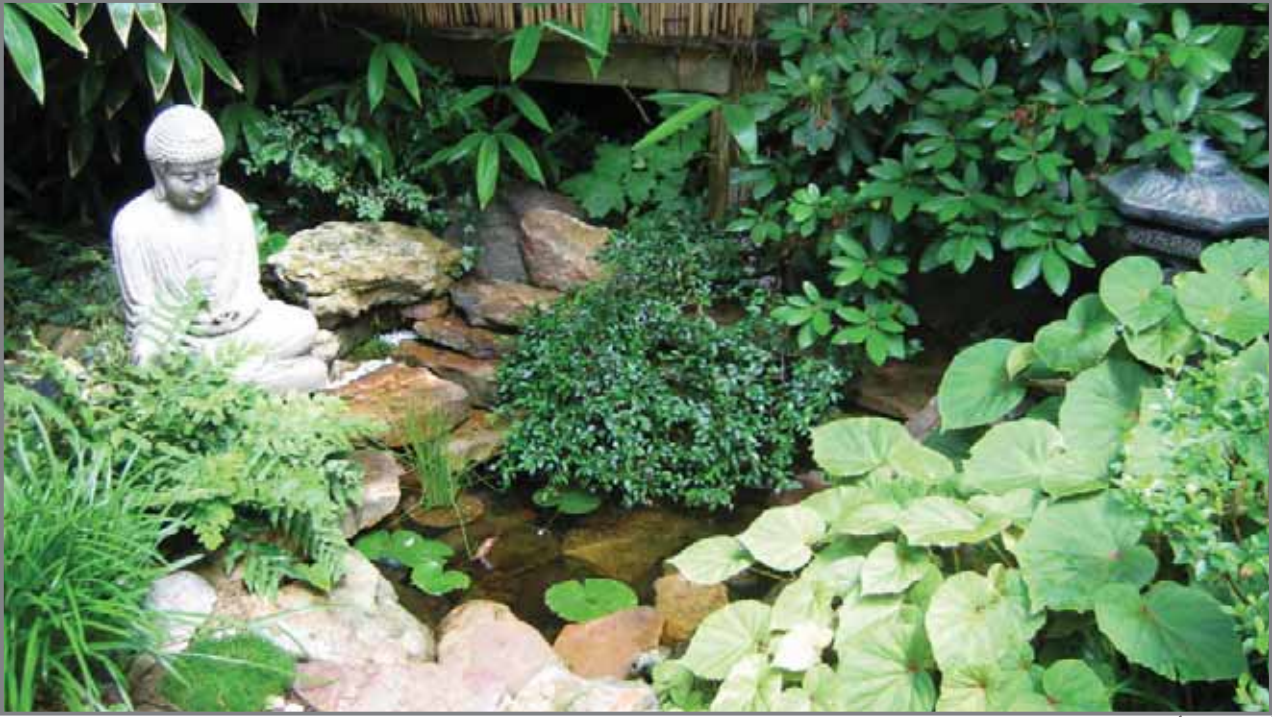
أسرار وراء أسوار الحديقة

العنصر الأساسي في تركيبه الحدائق اليابانية، ويساهم في إعادة إبراز مظاهر الطبيعة.