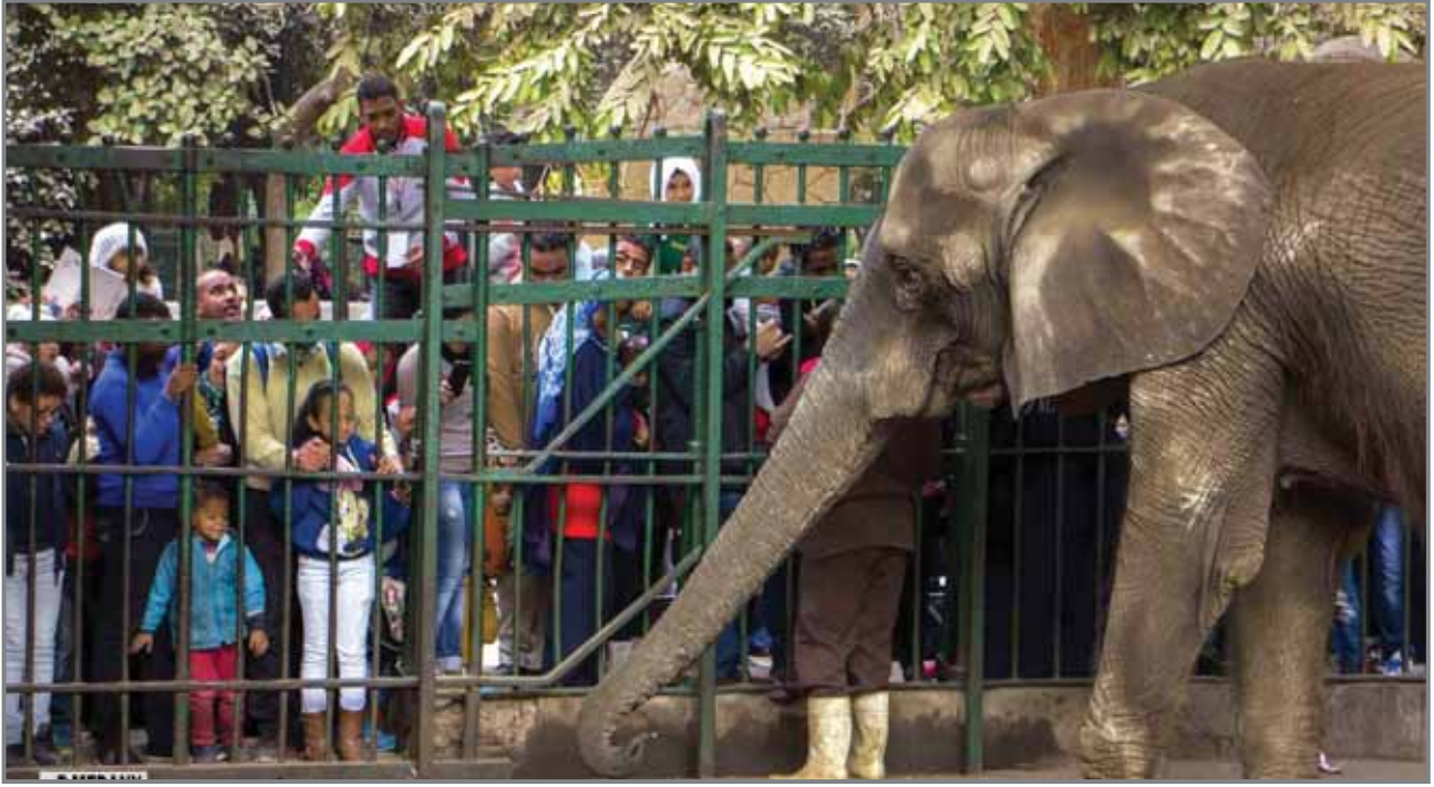
حكايات وذكريات في حديقة الحيوان