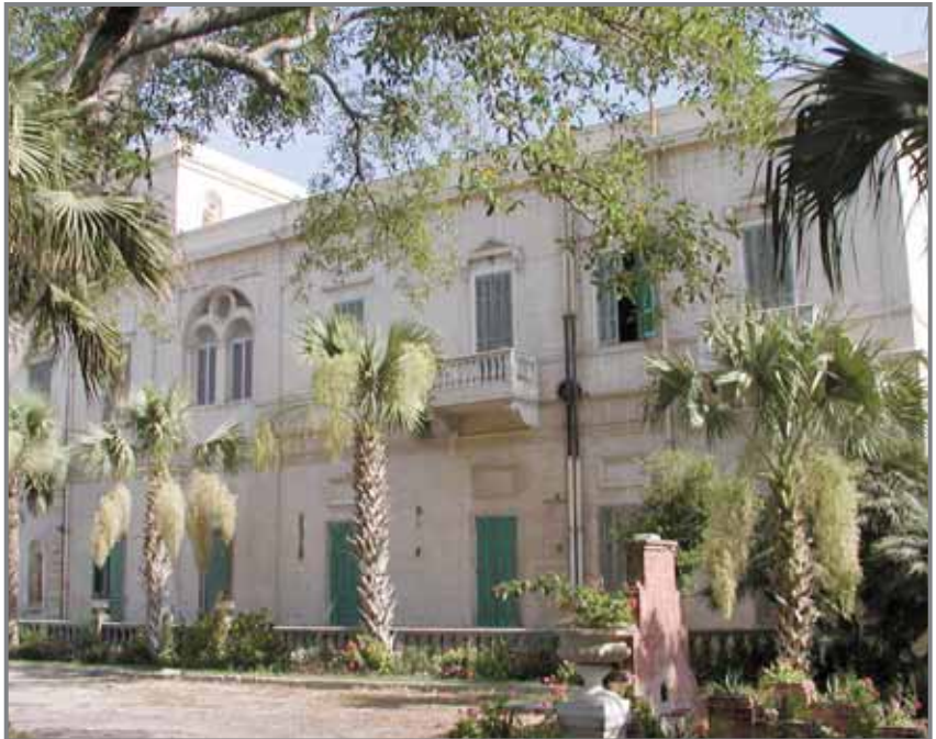
واجهات أنطونىادس فى حى سموحة