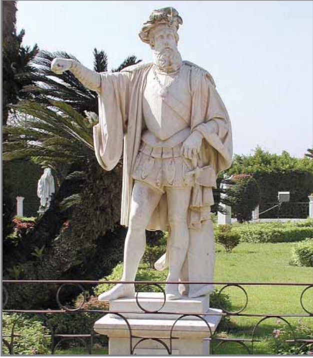
تمثال فاسكو دي جاما في مدخل الحديقة