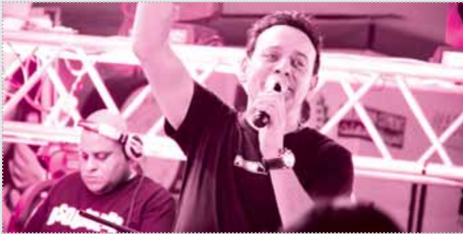
مصطفى قمر يبدأ بيزنس جديد