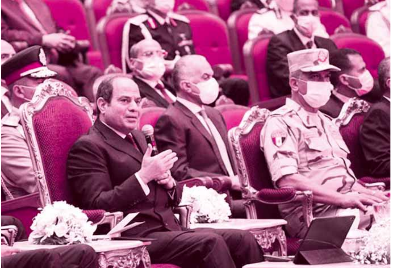
الرئيس السيسي دائم التأكيد على أهمية الوعي والفهم الحقيقي لمشكلات المجتمع