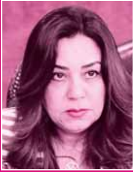
محافظ دمياط .. أفراح مصر