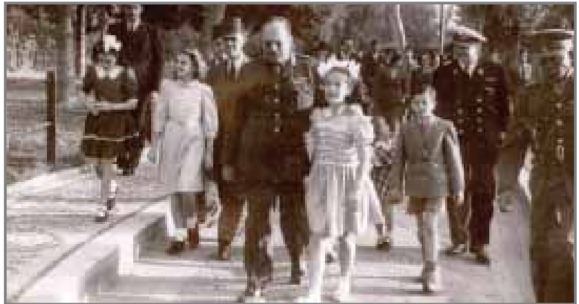
الملك فاروق فى زيارة تاريخية

« الكوبرى الأخضر بناه جوستاف أليكسون مصمم برج إيغل وهو أقدم كوبرى معلق فى إفريقيا والشرق الوسط