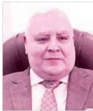
المستشار لاشين إبراهيم

وهي المحافظة التي شهدت أكبر نسبة إيجابية لتعاطى المخدرات بين المرشحين تسببت في استبعاد 17 مرشحاً، تلاها محافظة سوهاج التي شهدت استبعاد 16 مرشحاً، والشرقية التي شهدت استبعاد 6 مرشحين، و3 مرشحين من القليوبية، و4 مرشحين من المنوفية، وعدد آخر من محافظات الجيزة والقاهرة والإسكندرية.