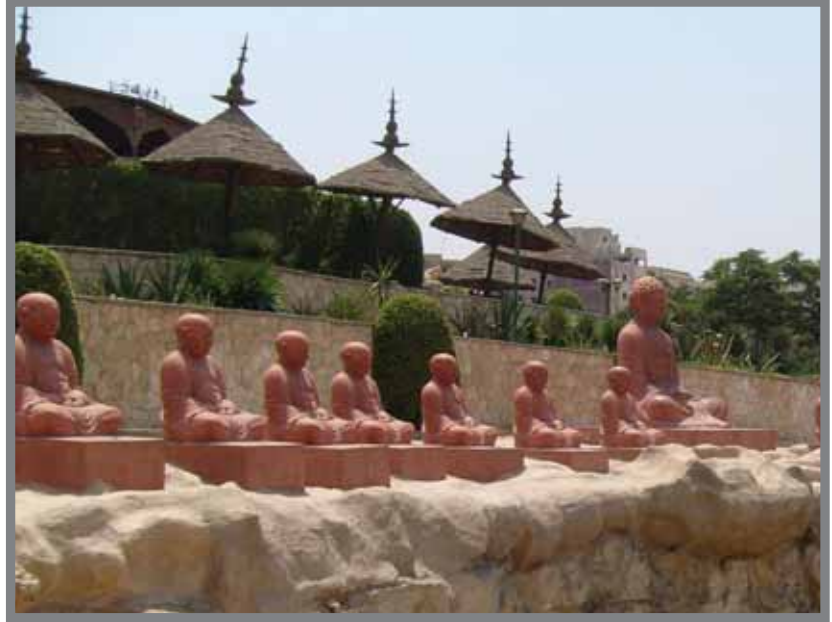
10 أفدنة تم الإنتهاء من تصميمها عام 1922

لكنها مع الوقت بدأت تفقد طبيعتها الرسمية فتحوّلت لحديقة عامة منذ عام 1990، وفي يناير 2005 أطلقت محافظة القاهرة مشروعًا كبيرًا لتطوير الحديقة وإنقاذها من الإهمال الذي كان قد أوشك على تشويه معالم الحديقة، وكادت الحديقة أن تلقى مصير كابريتا حلون الأثرى الذي انهارت معالمه بسبب الإهمال الشديد، لكن المشروع الذي تبنته محافظة القاهرة نجح في عودة الحياة للحديقة مرة أخرى؛ حيث تم افتتاحها في يونيو 2006 بتكلفة بلغت نحو 5 ملايين جنيه.. ومنذ ذلك الوقت أصبحت الحديقة مقصدًا للعامة في المناسبات والأعياد وأيام الإجازات.