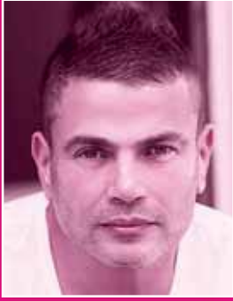
عمرو دياب .. عطر جديد