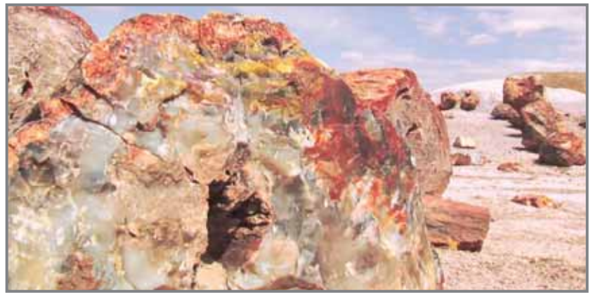
جانب من الغابة المتحجرة

وتتناثر على امتداد المحمية آثار بعض الحفريات التى لم يستدل عليها حتى اليوم، ومن بينها بعض أنواع من أسماك القرش التى تعد من أقدم الحيوانات البحرية التى عمرت الأرض، وهو ما يشير إلى أن مياه البحر زارت تلك المنطقة فى الزمان الغابر. وفى فبراير 2018 نفذت وزارة البيئة المرحلة الأولى من تطوير الغابة التى تضمنت إزالة 35 ألف متر مكعب من المخلفات المتراكمة بالمحمية، وتوسعة مداخل المحمية بالكامل وعمل لافتات وعلامات إرشادية، ولوحات معلوماتية جديدة ومظلات استقبال للزوار وأعمدة إنارة داخل المحمية وربطها بالمولد الكهربائى.