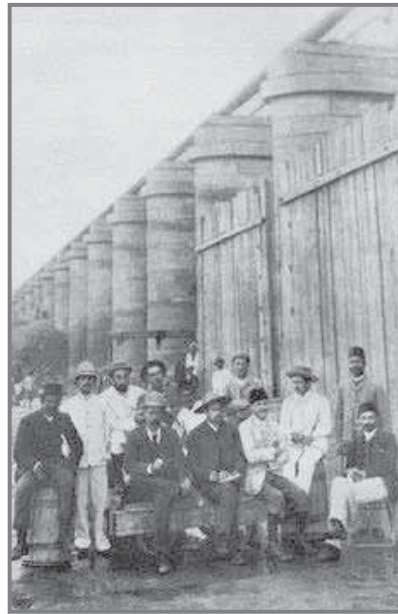
المهندسون الذين قاموا باصلاح وتقوية القناطر

والخير الوفير للمصريين فحسب.. فقد تميزت القناطر بعدة خصوصيات ميزتها عن باقى الحدائق التراثية والتاريخية ليس فى مصر فقط وإنما على مستوى العالم فى هذا الوقت الذى أنشئت فيه فى منتصف القرن التاسع عشر؛ فقد جمعت القناطر عناصر الجمال والفن والثقافة والفائدة والمتعة والترفيه أيضاً.