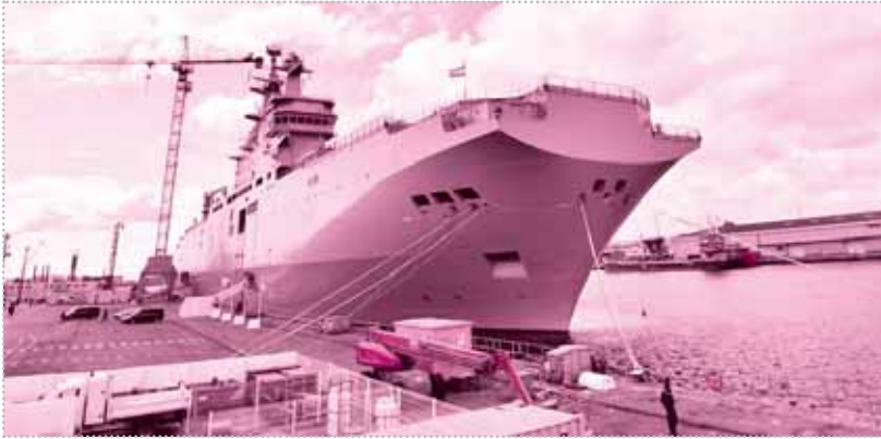
تطوير مستمر لقدرات القوات البحرية المصرية

لا تهدد ولا تتحدى، إنما تحمي وتردع من يحاول المساس بأمنها القومي، كما أن الجيش المصري قادر على التواجد في أماكن عدة خلال تدريباته المشتركة. وأشار اللواء مختار إلى أن تركيا عندما تعبر من قناة السويس، وتدفع كأي دولة رسوم المرور لا تتعرض لها ولا تهددها. مصر أيضا لديها الحق في إقامة تدريباتها ومناوراتها في أي مكان يتناسب معها، فالقوات المسلحة المصرية لا تهدد أي دولة طالما لا يوجد بينها وبينها أي حرب، وكما قال الرئيس السيسي من قبل: «نحن جيش يحمي ولا يهدد».