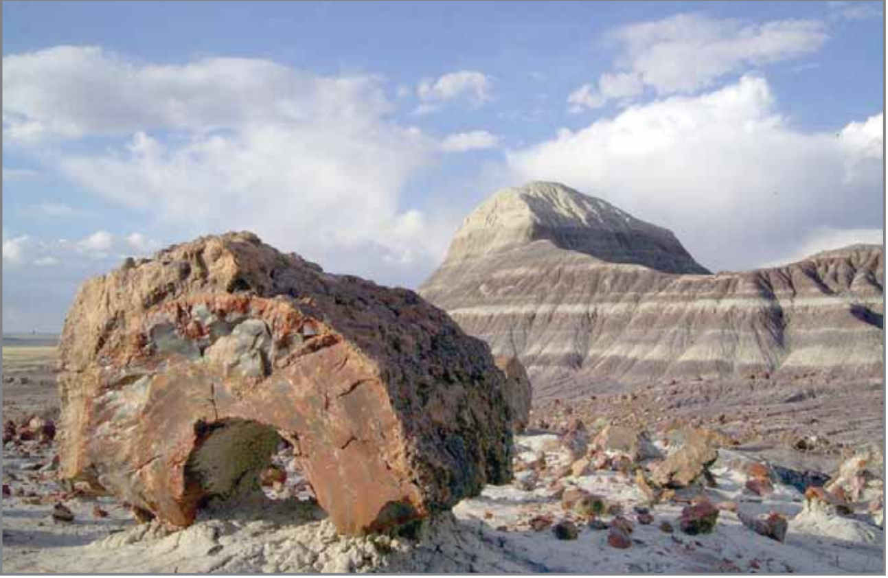
تاريخ الكوكب في غابة