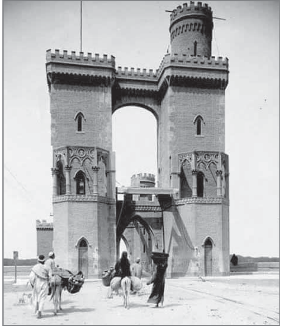
القناطر الخيرية عام 1912

وتم مؤخراً تطوير وتجديد حديقة "عفلة" بالقناطر الخيرية على مساحة نحو 13 فداناً، وجر دراسة إحياء حدائق القناطر الخيرية ضمن مشروعات إحياء الحدائق التراثية التي وجه الرئيس عبدالفتاح السيسى بإحيائها وإظهار تاريخها واستثمار مواردها الطبيعية كأحد مصادر الجذب السياحى فى مصر التي افتقدتها الأسرة المصرية.