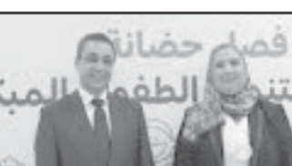
وزيرة الضمان وعلاء فتحي

المشروع بالتعاون مع جمعية خير وبركة من أجل تطوير ١٦٥ فصل فى ٥١ حضانه إجمالى استثمارات مشتركة ١٥ مليون جنيه مصرى.