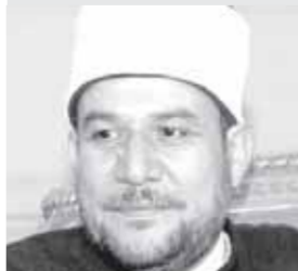
د.محمد مختار جمعة