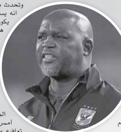
كتب - عمر عبدالحفيظ

وتحدث موسيماني عن والتر بواليا، قائلاً إنه يسعى إلى تسجيل الأهداف وربما يكون تحت ضغط، ولكن في النهاية هذا هو حال كرة القدم. واختتم موسيماني حديثه بالتأكيد أن الأهلي لم يكن يومه أمام البنك الأهلي، خاصة أن الفريق كان في منتصف ملعب المنافس طوال المباراة، وضغط بقوة ولكن الفريق غاب عن اللاعبين في أكثر من فرصة.