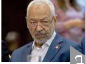
الإخوان يشعلون الشارع التونسي لخطف السلطة