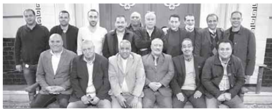
اجتماع رابطة الصعيد