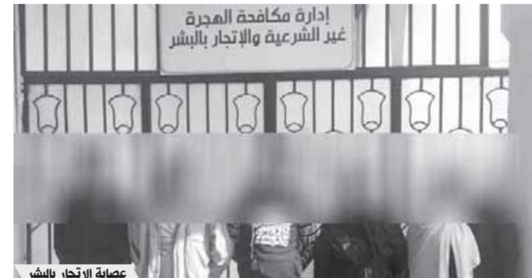
عصابة الاتجار بالبشر

عصابات سرقة السيارات، حيث استطاع أمن الغربية بقيادة اللواء هانى مدحت مساعد وزير الداخلية لأمن الغربية (عدد ٤ تشكيلات عصابية) وذلك على النحو التالى: (٤ أشخاص لهم معلومات جنائية مُقيمين بدائرة قسم شرطة المحلة) بإشراف اللواء محمد عمران مدير مباحث الغربية حيث دلت التحريات أن العصابة تخصصت فى ارتكاب حوادث سرقات السيارات بأسلوب كسر عجلة القيادة وإدارتها بمفك، مُتخذين من محافظات (الغربية- الدقهلية- كفرالشيخ) مسرحاً لمزاولة نشاطهم الإجرامى، وبحوزتهم (طبنجة وطلقتين من ذات العيار) وبمواجهتهم اعترفوا بقيامهم بارتكاب عدد (١٥) حادثة بذات الأسلوب وحيازتهم السلاح المضبوط لاستخدامه فى نشاطهم