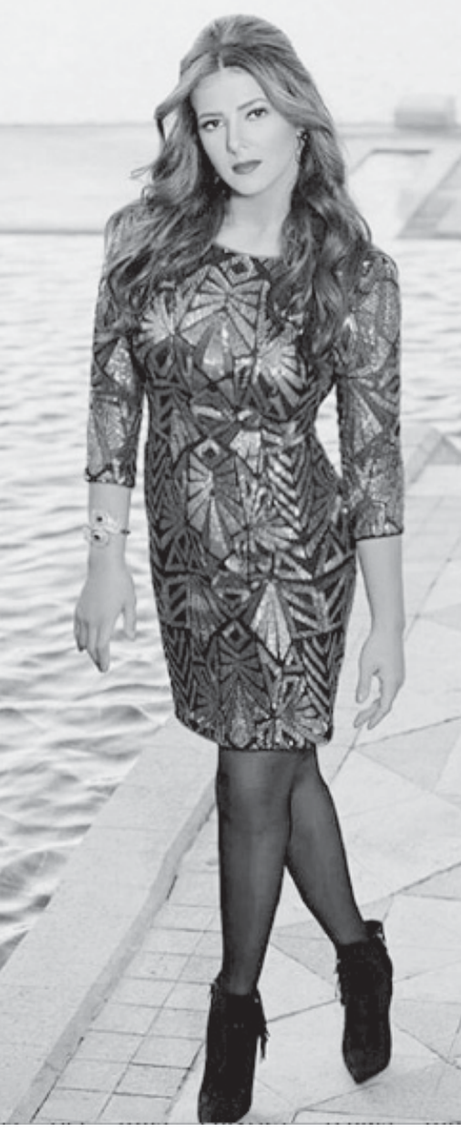
في دورته القادمة

يحيى حفلا غنائيا كبيرا في المسرح المكشوف بالمنازة يوم ٢ يوليو المقبل بمشاركة المايسترو أحمد عبدالشافي وطلب الحجاز من جمهوره أن يختاروا الأغاني التي يريدون الاستماع إليها خلال الحفل، وذلك عبر صفحته على موقع التواصل الاجتماعي الفيس بوك حتى يفنيها خلال الحفل.